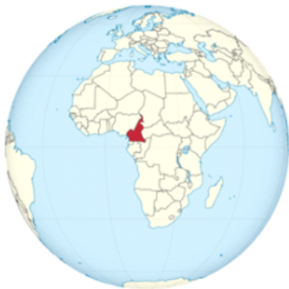
Lage von Kamerun auf der Erde