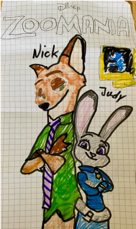
2. Nick und Judy aus Zootopia (Fadila)