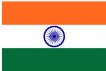
Die Flagge Indiens

Die Familie von Siraj stammt aus Indien.