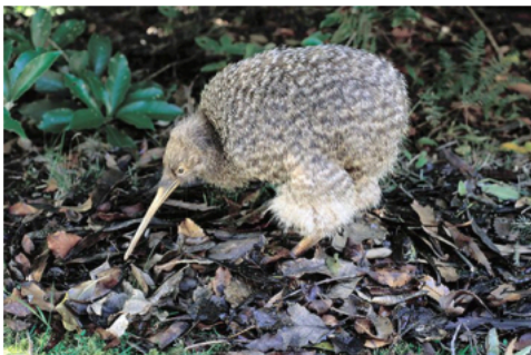
Der Vogel Kiwi