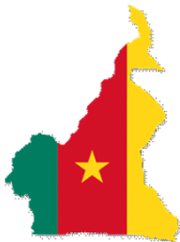
Form und Flagge Kameruns