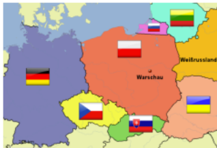
Unser Nachbarland Polen

Polen liegt in Europa und ist ein Nachbarland von Deutschland.